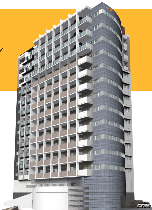
※パースはイメージです。

CMもご好評いただいております熊本駅前に登場した「ラ・シックシリーズ」。 オーナー様・入居者様へ完成見学会のご案内です。 コンセプトルーム「チョイス」・インターネット無料「メイワのヒカリ」など、 内観にも設備にもこだわった次世代マンションが完成いたしました。