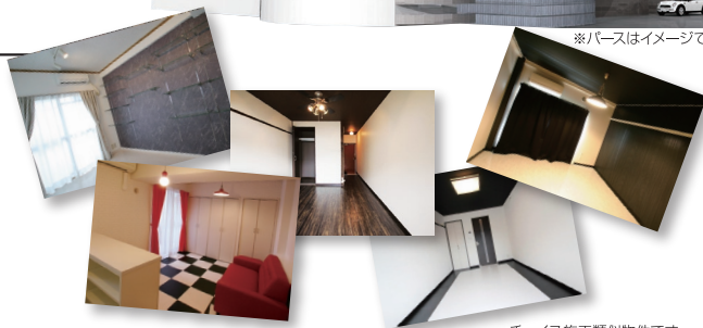
チョイス施工類似物件です。